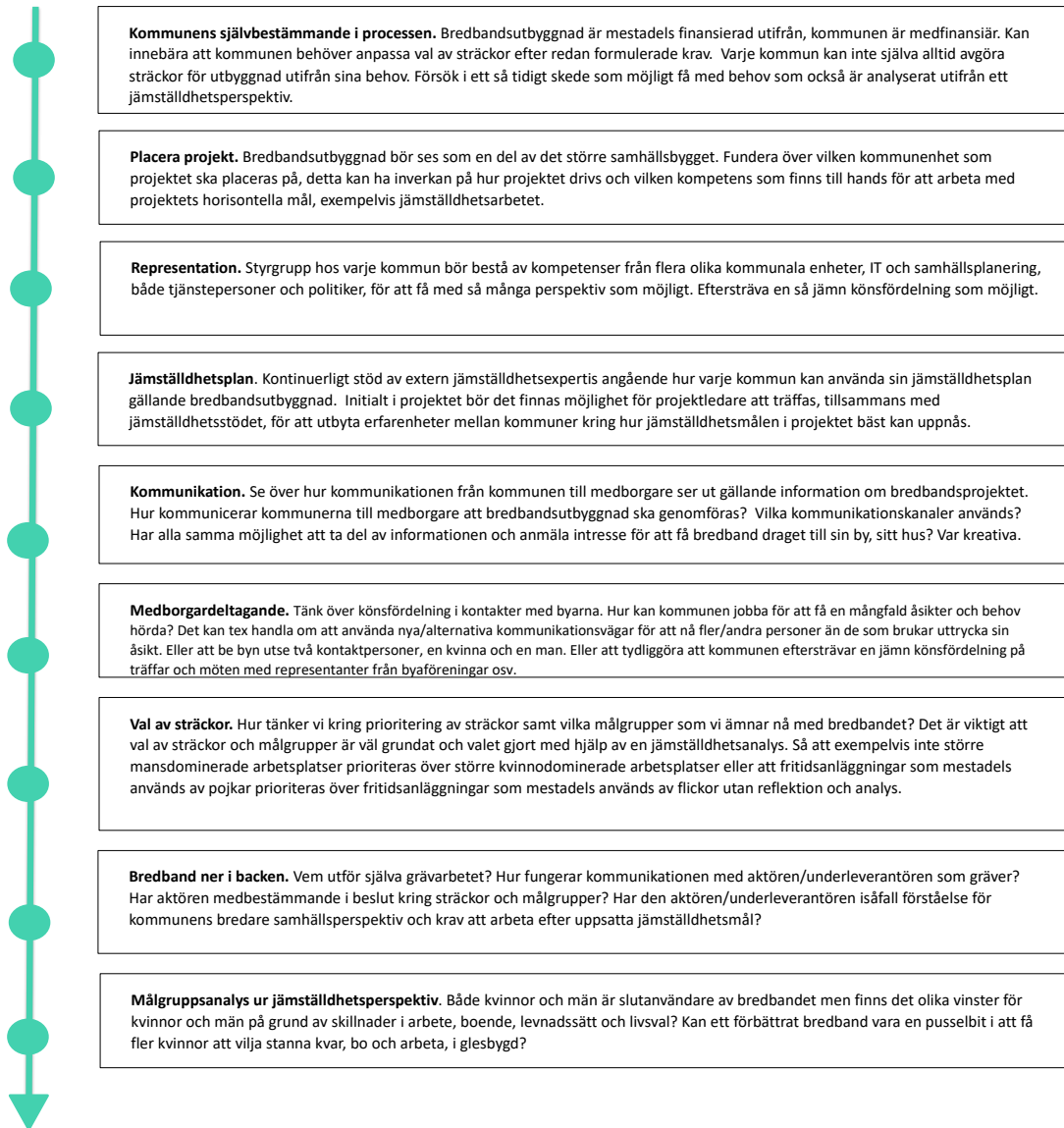
Figur 3 1 Förslag på hållpunkter för att integrera jämställdhetsperspektiv i kommunens beslutsprocess för bredbandsutbyggnad.